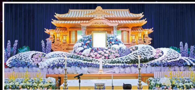
※祭壇については各ホ-ルの担当者へお問い合わせ下さい。